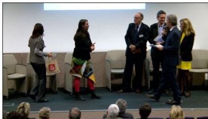
Remise des Trophées de l'Innovation

Los empresarios tienen el sentimiento de haber sido realmente escuchados; la proximidad de las instituciones, la eficacia de los consultores bien preparados han sido asimismo bien acogidas, y vertebradoras. Es fácil por tanto identificar las buenas prácticas: el encuentro de los actores en su