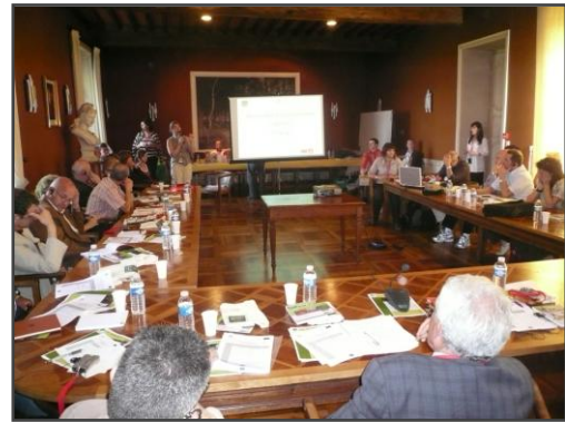
Rencontres transnationales de l'innovation, Figeac, juin 2010

Ha preparado y organizado seminarios transnacionales : seminario de lanzamiento en Saint-Girons (del 25 al 27 de mayo de 2009), visitas de estudio en Granada (del 20 al 22 de octubre de 2009), encuentros transnacionales de la innovación en Bragança ( del 20 al 22 de octubre de 2009), en Figeac ( del 7 al 9 de junio de 2010) y en Granada (del 24 al 25 de febrero de 2011), reunión técnica de