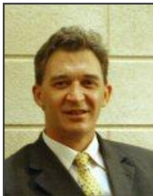
Les ambassadeurs de l'innovation du Pays de Figeac

a las innovaciones organizativas, de marketing u otras... El programa RIDER ha permitido movilizar como embajadores de la innovación a jefes de empresas que siguen activos en el territorio y que difunden las herramientas elaboradas en el marco de RIDER entre los demás jefes de empresas del territorio. Para las empresas, los resultados son visibles: aumento de la cifra de negocios, apertura de tiendas, creación de un sitio Internet, creación de empleos, obtención de ayuda financiera para la innovación, desarrollo de nuevos productos y salidas. Y en particular, ha habido una toma de conciencia por parte de los empresarios del interés que supone trabajar juntos, y han desarrollado un trabajo de proximidad y una participación activa. Finalmente, RIDER ha permitido también un acercamiento entre estructuras de acompañamiento económico, locales y regionales. Los lazos se han reforzado y los contactos son regulares ahora con Midi Pyrénées Innovation y Midi Pyrénées Expansion.