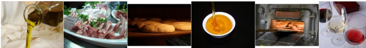
Produits agroalimentaires de Grenade

La Diputación de Granada ha escogido mutualizar las necesidades para mutualizar la oferta. Se concibió una plataforma interactiva de formación a partir del análisis en profundidades de las necesidades de un centenar de empresas agroalimentarias. Contenidos de formación, informaciones de toda clase, enlaces de Internet se mezclan a las preguntas-respuestas, entre actores: es una herramienta de vigilancia permanente , en la que se renuevan tanto las empresas como los técnicos que perciben las necesidades en tiempo real. Innovación también con el desarrollo de una gama territorial. La Diputación de Granada garantizaba el seguimiento del nuevo DOC (productos y/o filiales agroalimentarias), de manera relativamente independiente las unas de las otras. Con Rider, los responsables de las DOC se han movilizado y han desarrollado una gama territorial agroalimentaria para obtener una plusvalía de imagen global en la promoción y la comercialización de las producciones.