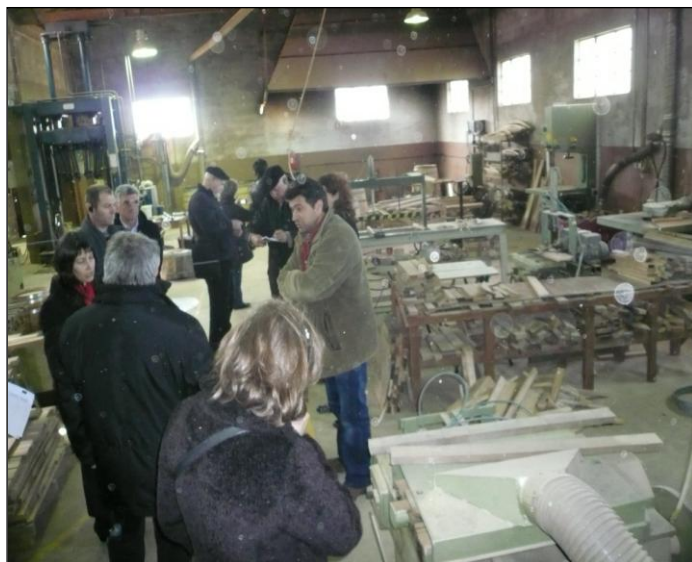
Rencontres transnationales de l'innovation, Corane, mars 2010

Los beneficios conseguidos a través de los intercambios interregionales en el marco de Rider son claros. Primero, con las experiencias adquiridas por el responsable técnico Corane, compartidas a posteriori con los emprendedores locales, y después con la visualización in situ de los embajadores de la innovación. Con estos, han podido enriquecer su saber-hacer y por consiguiente introducir una mejora de la actividad regional en el marco del proyecto RIDER.