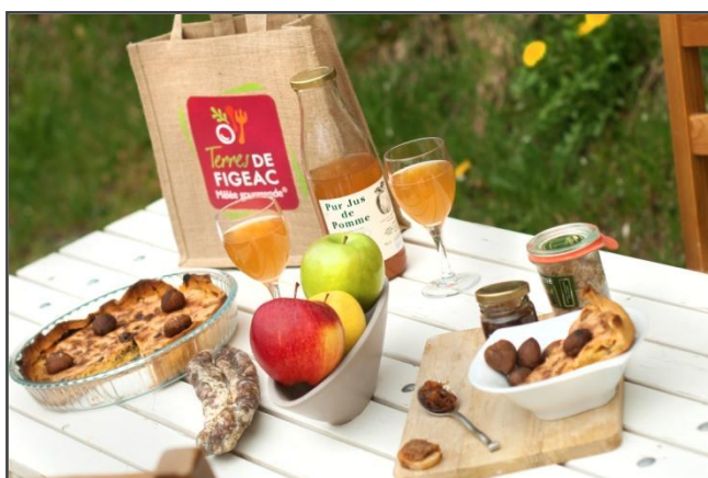
La Mêle Gourmande du Pays Figeacois

Un ejemplo entre otros, es el de los Embajadores de la innovación, iniciativa puesta en marcha en el territorio de Figeac . Para trabajar en estrecha colaboración con los empresarios, el pays de Figeac les ha propuesto participar activamente en la dirección del proyecto Rider, creando una red de una decena de Embajadores de la Innovación que aconsejan en las operaciones y cumplen un papel de enlace. En efecto, promover la innovación ante el conjunto de las microempresas es difícil debido a su tamaño, su número, su diversidad, y sus especificidades. El territorio es un marco oportuno que permite implicar a estos empresarios y también movilizar a todos los socios en un proceso coordinado. Una plataforma de servicios para la microempresa ha sido puesta en marcha para responder con coherencia al conjunto de las necesidades de la microempresa. El Pays de Figeac ha animado un colectivo de estructuras de partenariado, en la que cada una aporta su contribución específica sobre un diagnóstico global y compartido. Por último, en materia de método innovador y de gobernanza territorial, retendremos la creación de una