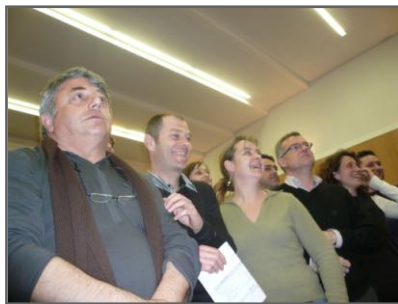
Séminaire d'étude, Grenade, octobre 2009

Como jefe de fila, ADEFPAT ha contribuido a la elaboración de un proyecto compartido entre los socios con distintos objetivos. Ha sido el caso de la innovación organizativa con plataformas locales de innovación en una red transnacional. Se trataba de organizar, en una escala de proximidad, una complementariedad de las competencias y de los recursos existentes en beneficio de las microempresas (vigilancia económica y estratégica de los territorios). Para la Innovación en marketing se crearon escaparates virtuales locales . En una lógica de diversificación de las microempresas, se trataba de dejarlas definir una estrategia colectiva e innovadora de promoción de los productos y servicios según las necesidades de los consumidores (ecoedificación, servicios a los habitantes).