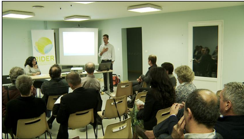
Soirée de l'innovation en Pays Couserans

La celebración regular de « veladas de la innovación », veladas temáticas destinadas a empresas y que se centran en la intervención de una institución económica, el testimonio de un jefe de empresa, la visita de la empresa de acogida, el buffet que prolonga los debates y refuerza el grupo.