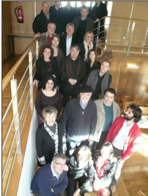
Rencontres transnationales de l'innovation, Corane, mars 2010

Evolución de la noción de innovación, en primer lugar con un acompañamiento lineal de la innovación, de la concepción de puesta en el mercado, hasta el refuerzo de los socios locales, a la ampliación y la activación de los efectos de redes institucionales y técnicas, un papel que es a la vez el relevo y específico de los territorios a modo de ensamblador con efecto palanca de las políticas e desarrollo.