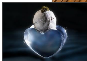
A gauche : glace du Pays de Couserans - Caviar 2008 A droite : couteaux de Corane