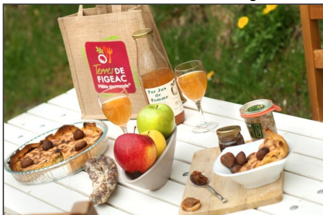
Le panier « Terres de Figeac Mêlée Gourmande »

Ainsi, entre autres exemples, concernant les Ambassadeurs de l'innovation mis en œuvre sur le territoire de Figeac . Pour travailler en étroite collaboration avec les chefs d'entreprise, le pays de Figeac leur a proposé de participer activement à la conduite du projet Rider en créant un réseau d'une dizaine d'Ambassadeurs de l'Innovation conseillant l'opération et remplissant un rôle de relais. En effet, promouvoir l'innovation auprès de l'ensemble des TPE est difficile du fait de leur taille, leur nombre, leur diversité, leurs spécificités. Le territoire est un cadre opportun qui permet à la fois de toucher ces chefs d'entreprise, mais aussi de mobiliser tous les partenaires dans une démarche coordonnée. Une plate-forme de services pour la TPE a été mise en place pour répondre en bonne cohérence à l'ensemble des besoins de la TPE. Le Pays de Figeac a animé un collectif de structures partenariales qui apportent chacune sa contribution spécifique sur un diagnostic global et partagé. Enfin, en matière de méthode innovante et de gouvernance territoriale, on retiendra la création d'un