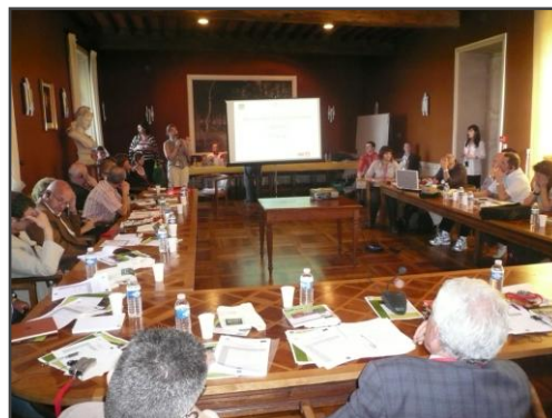
Rencontres transnationales de l'innovation, Figeac, juin 2010

Elle a préparé et organisé des séminaires transnationaux : séminaire de lancement à St Giron (25 au 27 mai 2009), visites d'études à Grenade (20 au 22 octobre 2009), rencontres transnationales de l'innovation à Braganca (20 au 22 octobre 2009), à Figeac (7 au 9 juin 2010) et à Grenade (24 au 25 Février 2011), réunions techniques de gestion et communication à Madrid (30 Mai 2011),